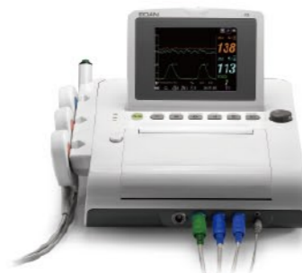
F3 Monitor fetal